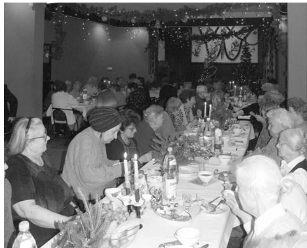
Wśród mieszkańców osiedli Sobieskiego i Młodych spotykających się w Scenie 210 tradycyjnie panowała rodzinna atmosfera.