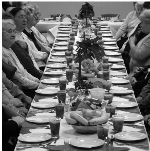
Mieszkańcy osiedli Jagiellońska i Batory przy wspólnym, suto zastawionym stole.