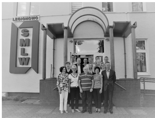
Na zdjęciu: członkowie wybranej przez Walne Zgromadzenie na kadencję 2017/2020 Rady Nadzorczej SMLW.

Do punktu porządku obrad dotyczącego wyżej wymienionego wniosku został zaproszony na posiedzenie Rady jego wnioskodawca, który przedstawił swoją wizję kontynuowania działalności społeczno-kulturalnej. Ponieważ wprowadzenie odpisu na tę