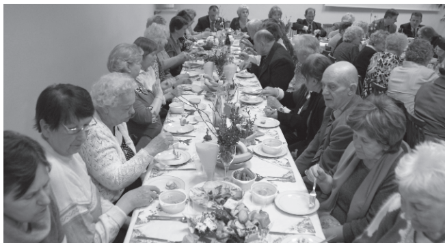
Przy wspólnym stole tradycyjnie panowała przyjazna atmosfera.