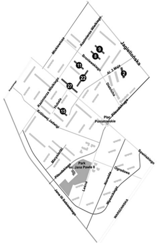
Powyżej: Mapa osiedla Jagiellońska z zaznaczonymi budynkami o nieuregulowanych gruntach.