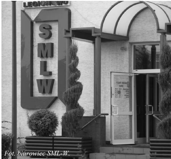
Fot. biurowiec SML-W.

4 lipca 2008 roku odbyło się, zgodnie z przepisami Statutu SML-W (§ 32 ust. 6-8) posiedzenie Kolegium. W jego skład wchodzi przewodniczący i sekretarze wszystkich części Walnego Zgromadzenia. Kolegium zebrało się po zakończeniu Walnego Zgromadzenia odbywanego w częściach w celu potwierdzenia, które uchwały zostały podjęte.